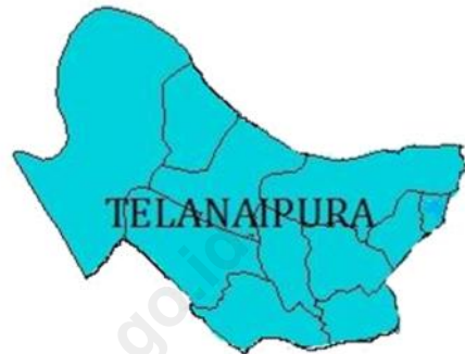
Luas Kelurahan di Kecamatan Telanaipura